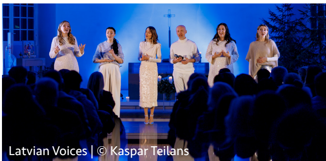
Latvian Voices